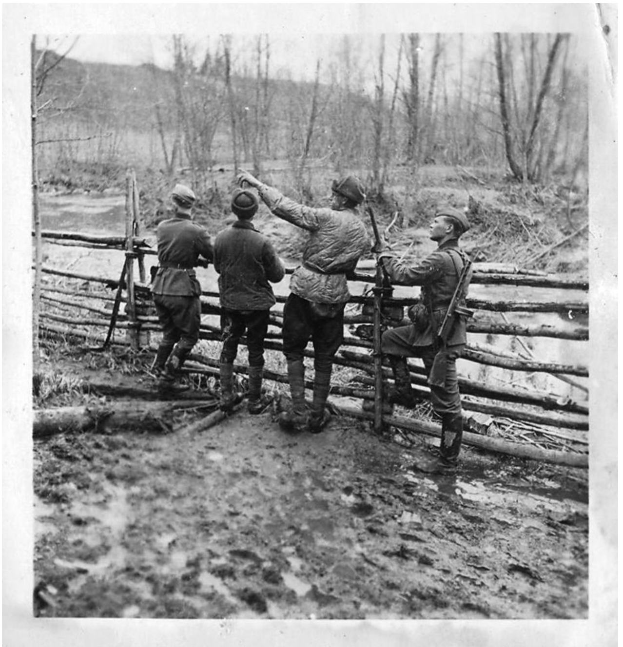
Двое перебежчиков - Демянский котел, 1942 год.