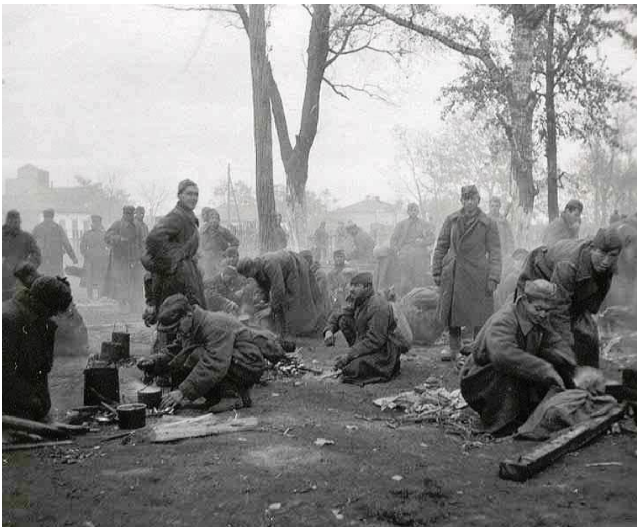
Лагерь военнопленных в Демянске