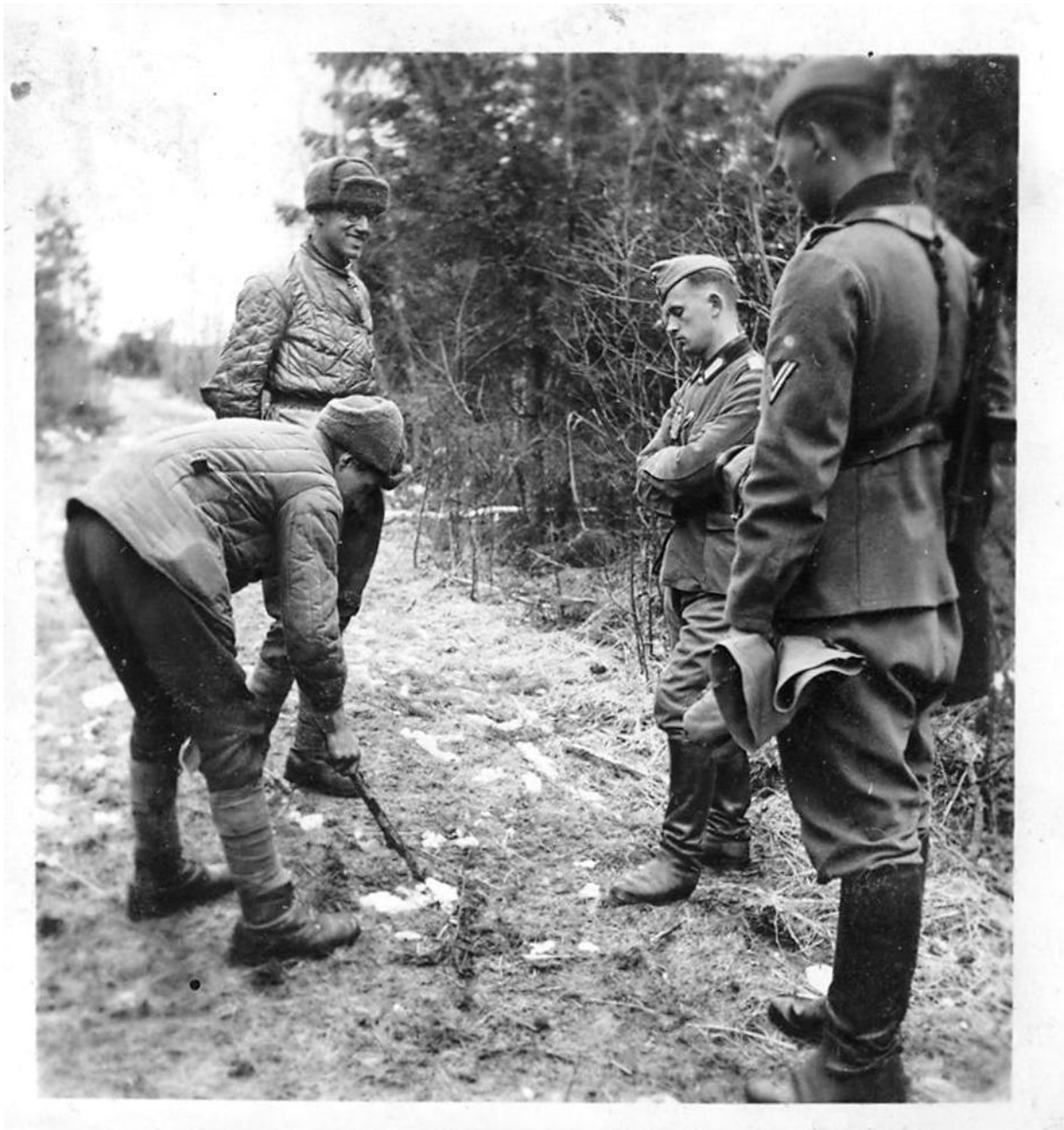
Перебежчики показывают, где им ночью удалось перейти через линию фронта - Демянский котел, 1942 год.