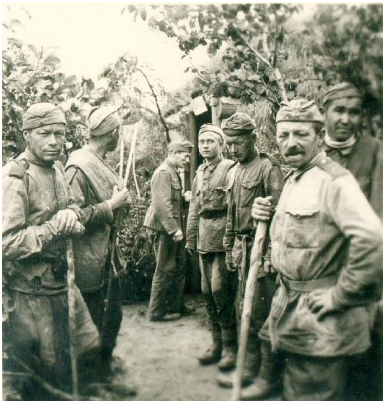
Пленные красноармейцы, 1942 год.