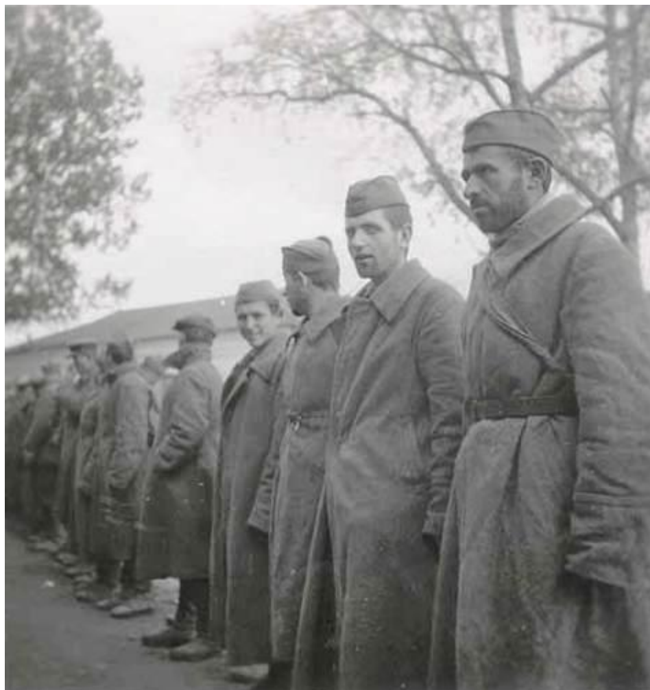
Пленные красноармейцы в Демянске