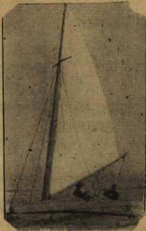
На рижском взморье.

Я крепко дружу с бойцами своего отделения. В свободную минуту читаю им газету, вместе поем песни. Почти все бойцы читают мне письма, получаемые от родных и знакомых. Отдельным товарищам часто помогаю писать ответные письма. У нас дружная солдатская семья, но нет панибратства.