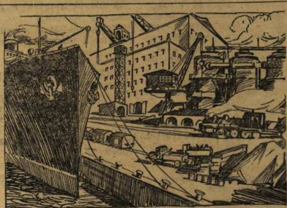
В рижском порту.