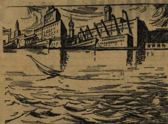
В рижском порту.

Совет Народных Комиссаров Эстонской ССР принял постановление об увековечении памяти выдающихся деятелей эстонского народа, павших в борьбе за советскую власть. В городе Таллине будут воздвигнуты памятники вождю эстонского рабочего движения Виктору Кингисепу и бывшему председателю Совнаркома Эстонской ССР Ноханесу Лаурисину, погибшему от руки немецко-фашистских оккупантов.