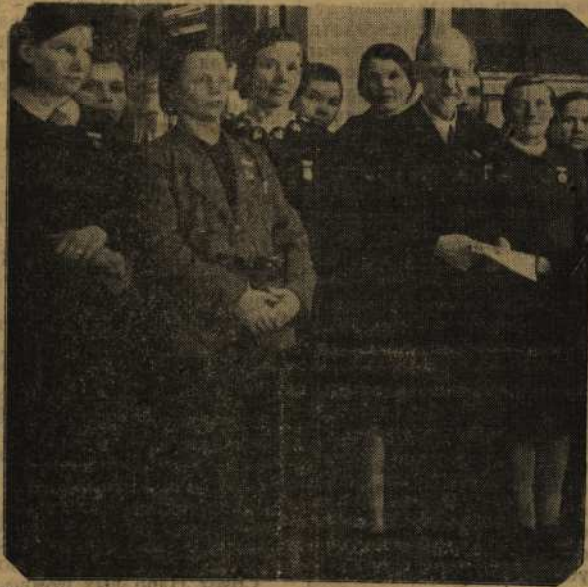
Председатель Президиума Верховного Совета Латвийской ССР профессор КИРШЕНШТЕЙН среди знаменитых женщин Латвии.

Сегодня латышский народ отмечает историческую дату — пятилетие Советской Латвии. Радостно смотрит Латвия в свое лучезарное будущее. Ее сыны и дочери залечивают раны, нанесенные войной, ликвидируют последствия немецко-фашистской оккупации. Их вдохновляют идеи великого Сталина, могучая сила советского патриотизма, искренняя благодарность народам СССР, помогшим Латвии сбросить мрачное иго немецкого фашизма.