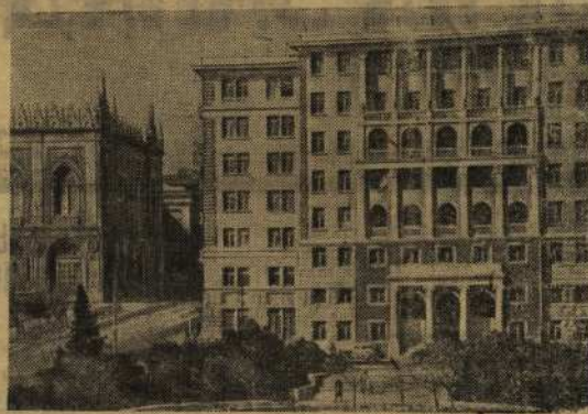
По городам Советского Союза. На снимке: жилой дом, недавно построенный в г. Баку.