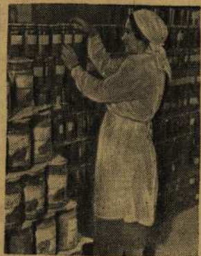
Ростовский-на-Дону консервный завод „Смычка“ из месяца в месяц дает сверх плана тысячи банок высококачественных консервов.

На беседе присутствовал Народный Комиссар Иностранных Дел СССР В. М. Молотов.