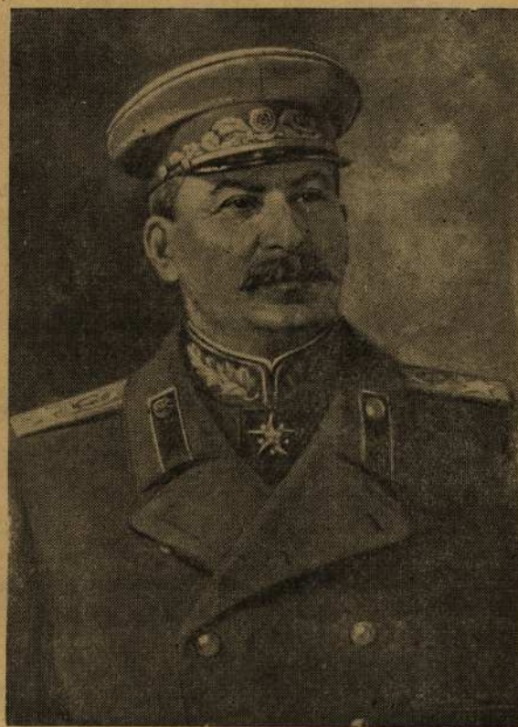
Верховный Главнокомандующий всеми вооруженными силами СССР Генералиссимус Советского Союза Иосиф Виссарионович СТАЛИН.

Здравницу в честь великого Сталина провозглашают гвардии старшина Чаенков и гвардии рядовой Султан. Свою речь тов. Султан произносит на родном языке.