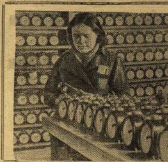
*** Второй Московский государственный часовой завод. На снимке: просмотр выпущенных будильников.