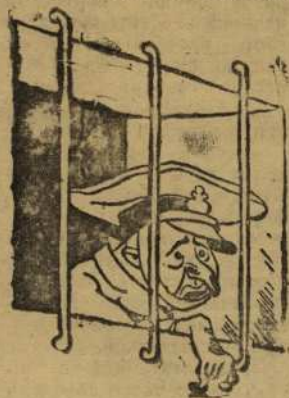
Рис. худ. Б. Ефимова.