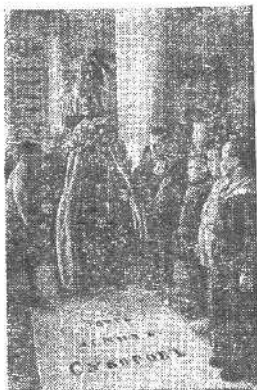
В этом году Ленинград впервые послал группу детей в суворовские училища Тулы и Горького.

На снимке: юные ленинградцы, зачисленные в суворовские училища, позлагодуют венком на могилу Суворова в Александрово-Невском лауре.