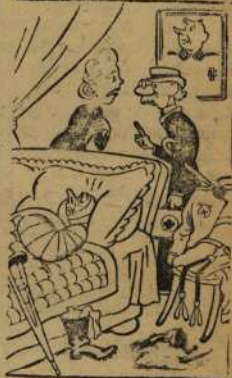
Рис. художника Лис

— Ганс совсем лишился языка, вот уже месяц как он не говорит ни слова.