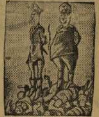
Рис. художника МОА

Теперь орет он громче вдвое. Но не грозит, а в страхе вост.