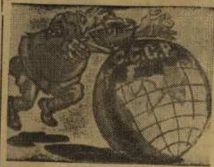
Рис. художника П. Соколова-Скаля Текст О. Брик

Орал он грозно: "Эй, за мной! Мы завоюем шар земной!"