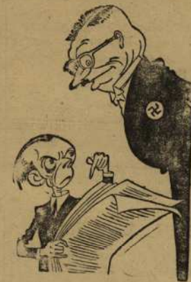
Рис. художника Лис