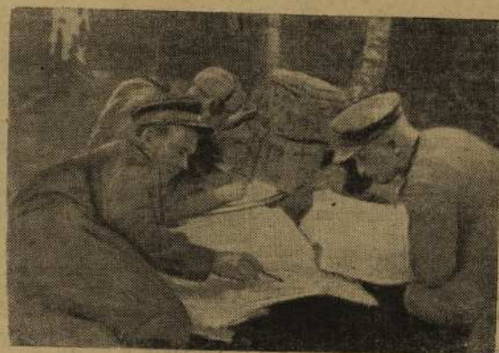
У топографической карты. Офицеры решают направление удара.