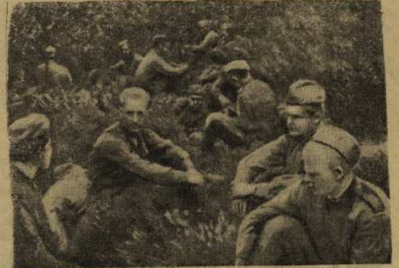
Гвардейцы на привале.