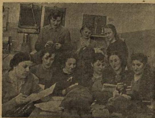
Стахановки Н-ского завода (г. Молотов) готовят подарки воинам Красной Армии.