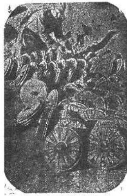
На дорогах наступления. Склад немецких мин, захваченный нашими войсками.