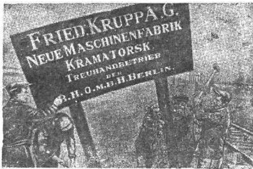
В ОСВОБОЖДЕННОМ ДОНБАСЕ.

На снимке: рабочие Краматорского машиностроительного завода срывают с заводского здания вывеску германского капиталиста Круппа, хозяйничавшего здесь во время немецкой оккупации Краматорска.