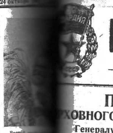
Весьма интересный материал из Восточной Украины. 4-х фотоработы. Свои снимки сдерживать помогало высокое положение на высоте Гомель.