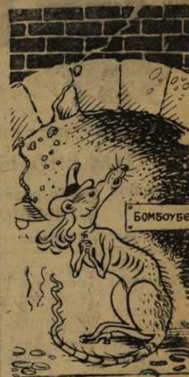
Рис. В. Васильева.

«Мы, как крысы — глубоко в земле...» (Из письма фрау Розеве из Кельна своему мужу Рудольфу на советско-германский фронт).