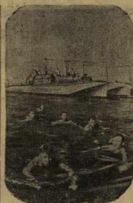
Черноморский флот. Моряки торпедных катеров после боевого похода.