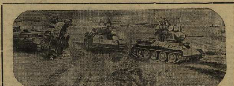
Действующая армия. На снимке: недавнее поле боя. Слева — подбитый немецкий танк. Справа — советские танки продвигаются вперед, преследуя отступающего врага.