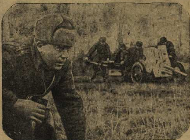
... Показались вражеские танки. На открытую огневую позицию выкапывают истребители танков свое грозное орудие.

На одном участке Западного фронта наши артиллеристы и минометчики произвели огневой налет на позиции противника, уничтожили 3 немецких артиллерийских батареи, несколько пулеметов и разрушили 19 блиндажей противника. Когда вражеские огневые точки были подавлены, советские разведчики с нескольких направлений одновременно атаковали укрепленный пункт обороны противника. В завязавшемся бою немцы потеряли убитыми 70 и ранеными до 130 солдат и офицеров. Разведчики захватили пленных и трофеи.