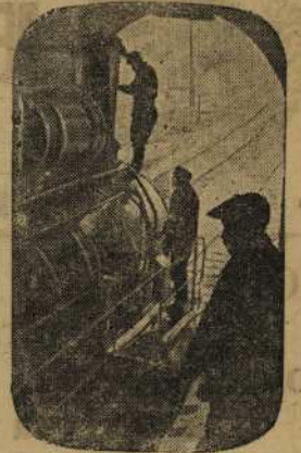
Ремонт паровозов для железных дорог Юга, освобожденных от фашистских захватчиков.