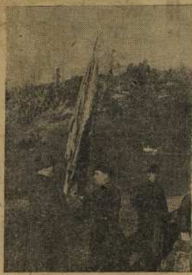
Вручение боевого знамени.