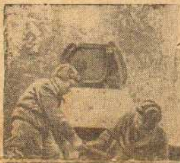
Танкисты перед боем.