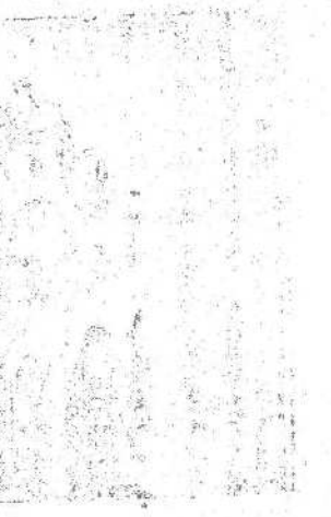
Артиллерия перемещается на новые позиции

Орудие наводчика Василия Тарасова стояло у дороги. Когда наша пехота пошла в наступление, немцы пустили по дороге танки. Орудие по ним огонь. Но от разорвавшегося снаряда был выведен из строя весь расчет, кроме наводчика. Оставшись один, Тарасов продолжал вести обстрел. Вот запылала головной танк. Нацелив на него мишину, пыталась