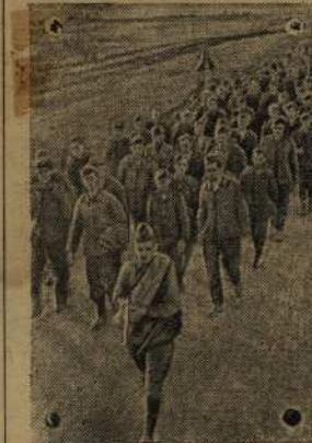
ДЕЙСТВУЮЩАЯ АРМИЯ. На снимке: группа немецких солдат и офицеров, захваченных в плен в районе Зубцова.

ждал, пока фашисты подойдут поближе. И когда они были рядом, так, что он ясно различал их звериные лица, боец нажал на спус-