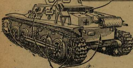
Бей из пушки, противотанкового ружья и противотанковой гранатой по бортам, башне, бензобак и двигателю