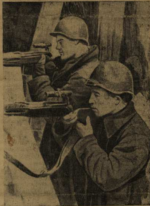
Снайперы ведут огонь по врагу.