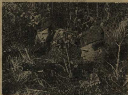
Разведчики в засаде

Множить ряды таких агитаторов, всемерно поддерживать и поднимать этих людей — благородная задача партийно-политического аппарата.