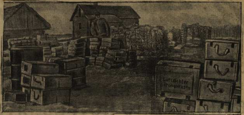
Наши части заняли пункт К. При отступлении немцы бросили много своей техники и боеприпасов. На снимке: склад боеприпасов, захваченный нашими бойцами в пункте К.