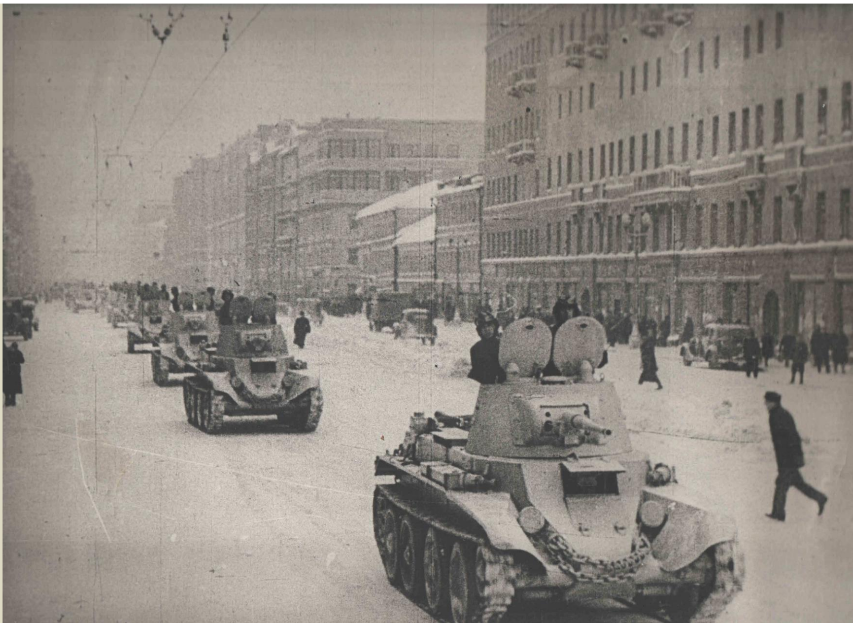
МОСКВА ЗИМОЙ 1941