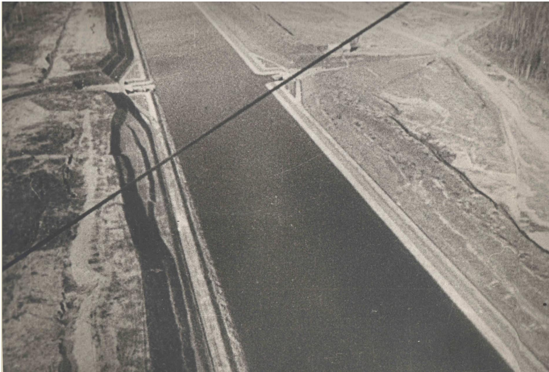
КАНАЛ ВОЛГА - МОСКВА