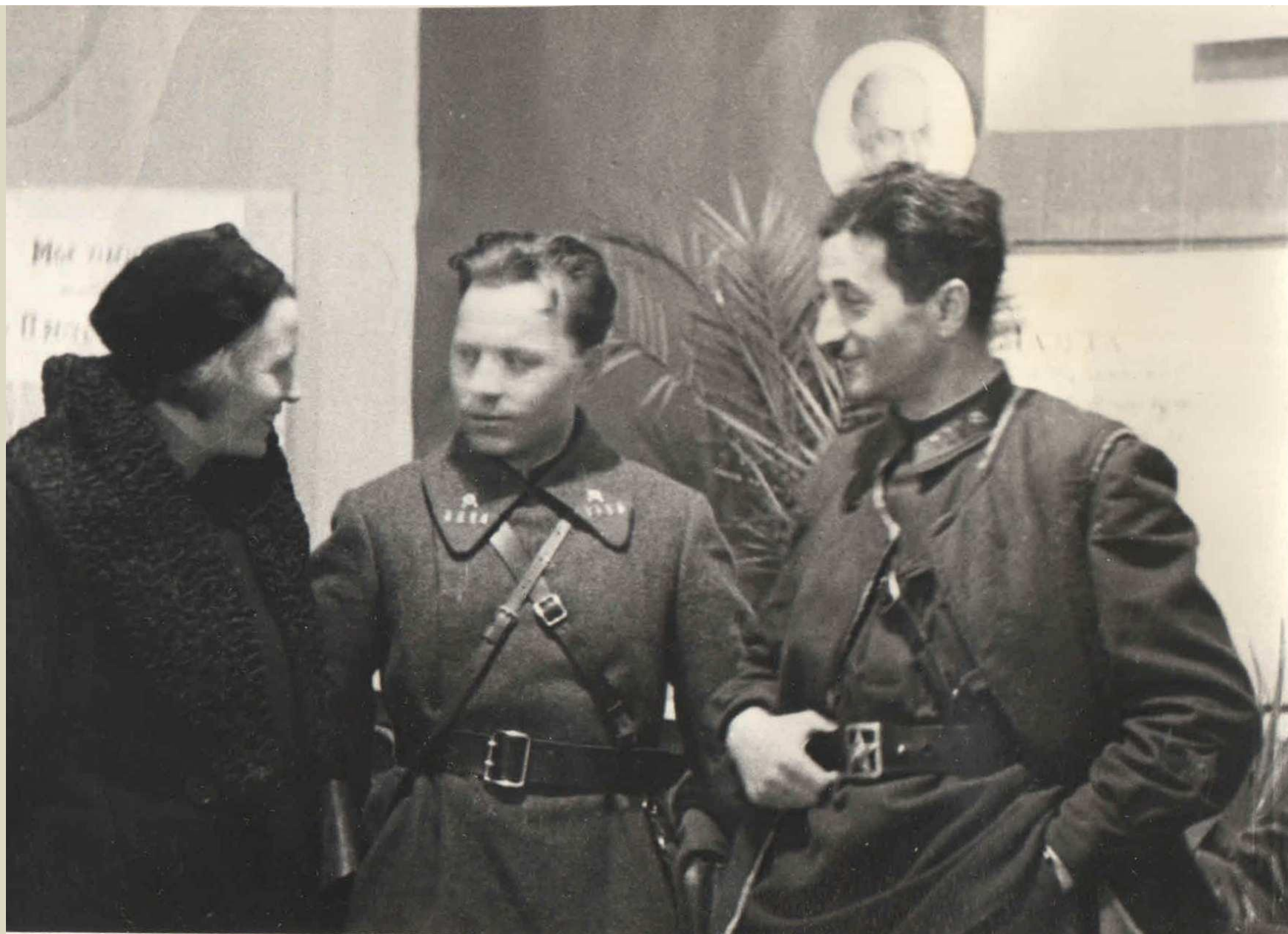
В ПОЛИТОТДЕЛЕ ДИВИЗИИ