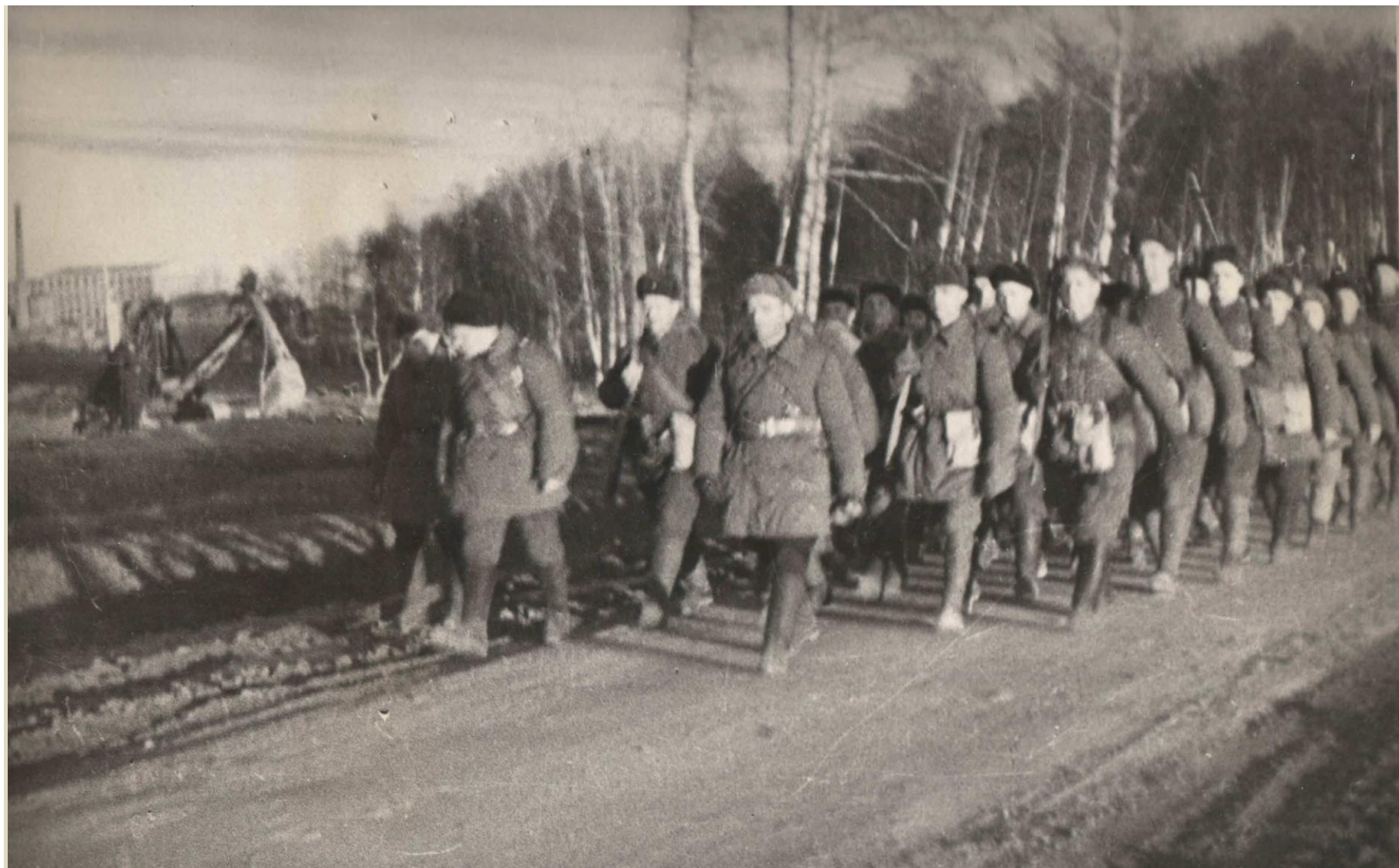
ВЫХОД НА РУБЕЖ ОБОРОНЫ