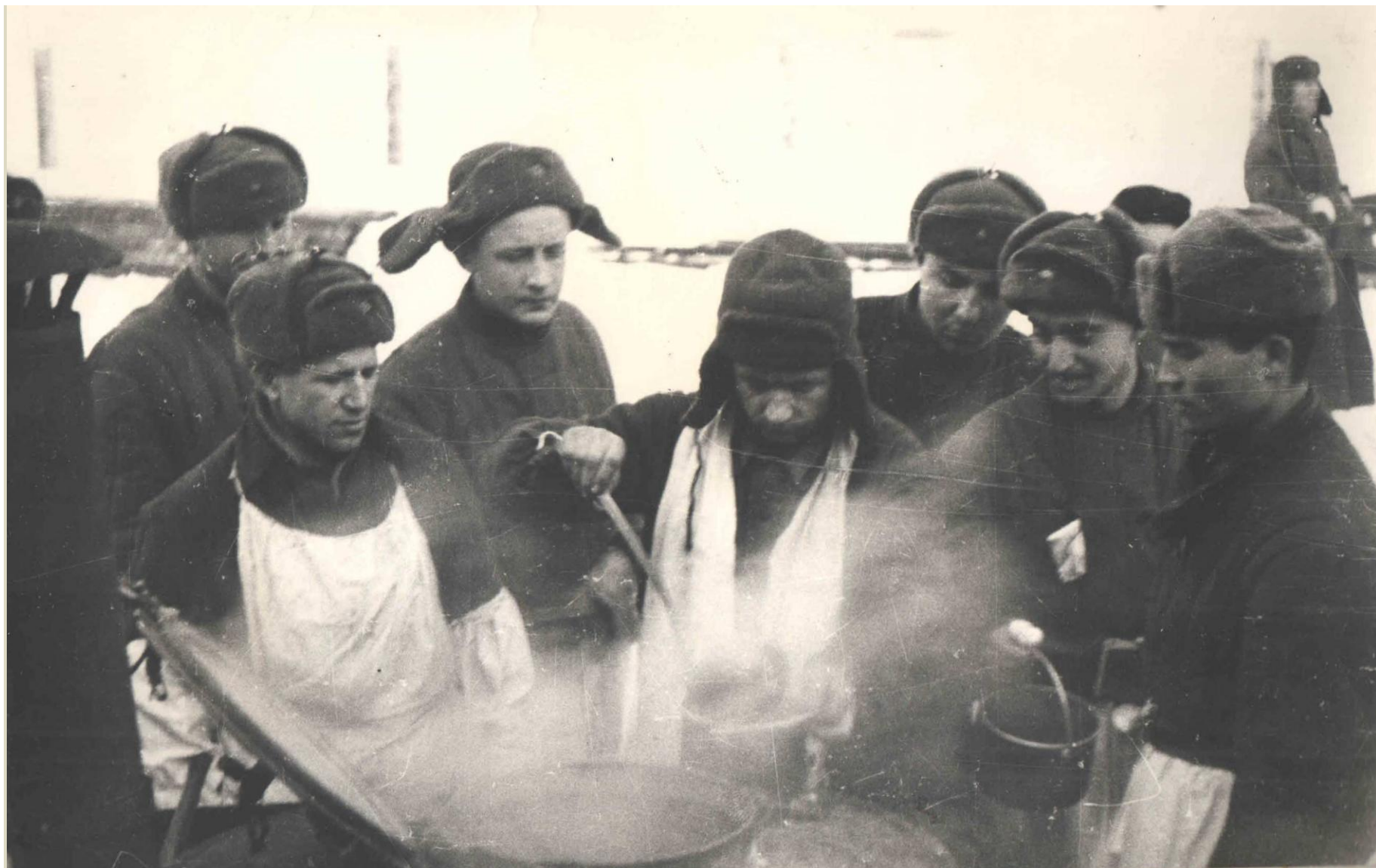
ВСЕГДА ДОЛГОЖДАННЫЙ ОБЕД