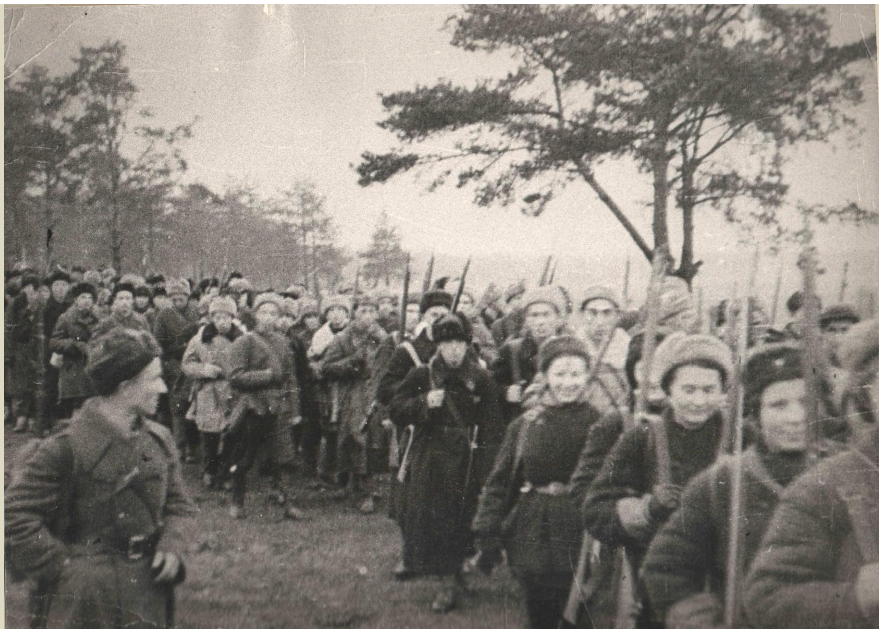
ДОБРОВОЛЬЦЫ ВЫХОДЯТ НА БОЕВЫЕ ПОЗИЦИИ