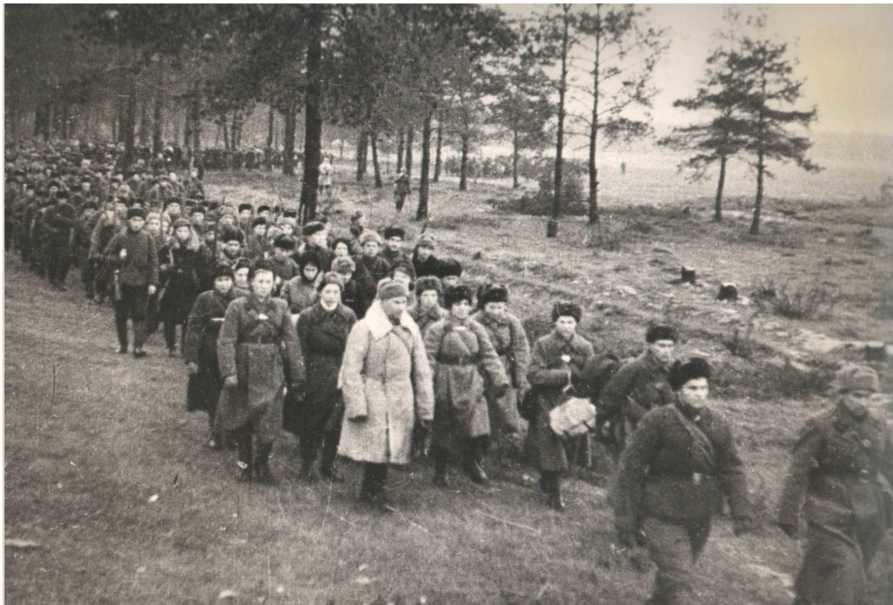
ДОБРОВОЛЬЦЫ ВЫХОДЯТ НА БОЕВЫЕ ПОЗИЦИИ