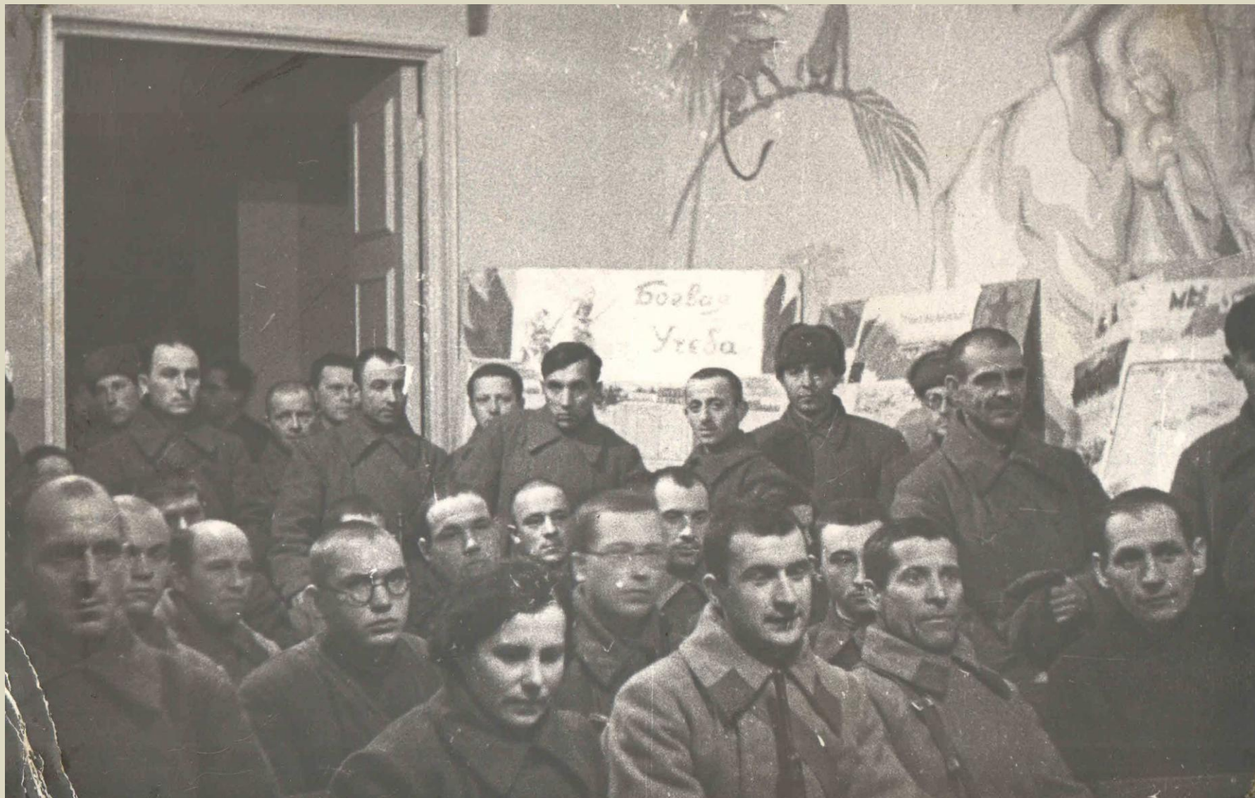
декабрь 1941. РЕЧНОЙ ВОКЗАЛ. ХИМКИ. СЛЕТ ВОЕНКОРОВ ДИВИЗИИ