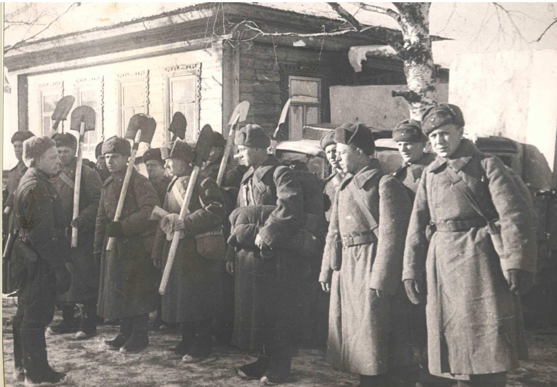
НА СТРОИТЕЛЬСТВО ОБОРОНИТЕЛЬНОЙ ЛИНИИ