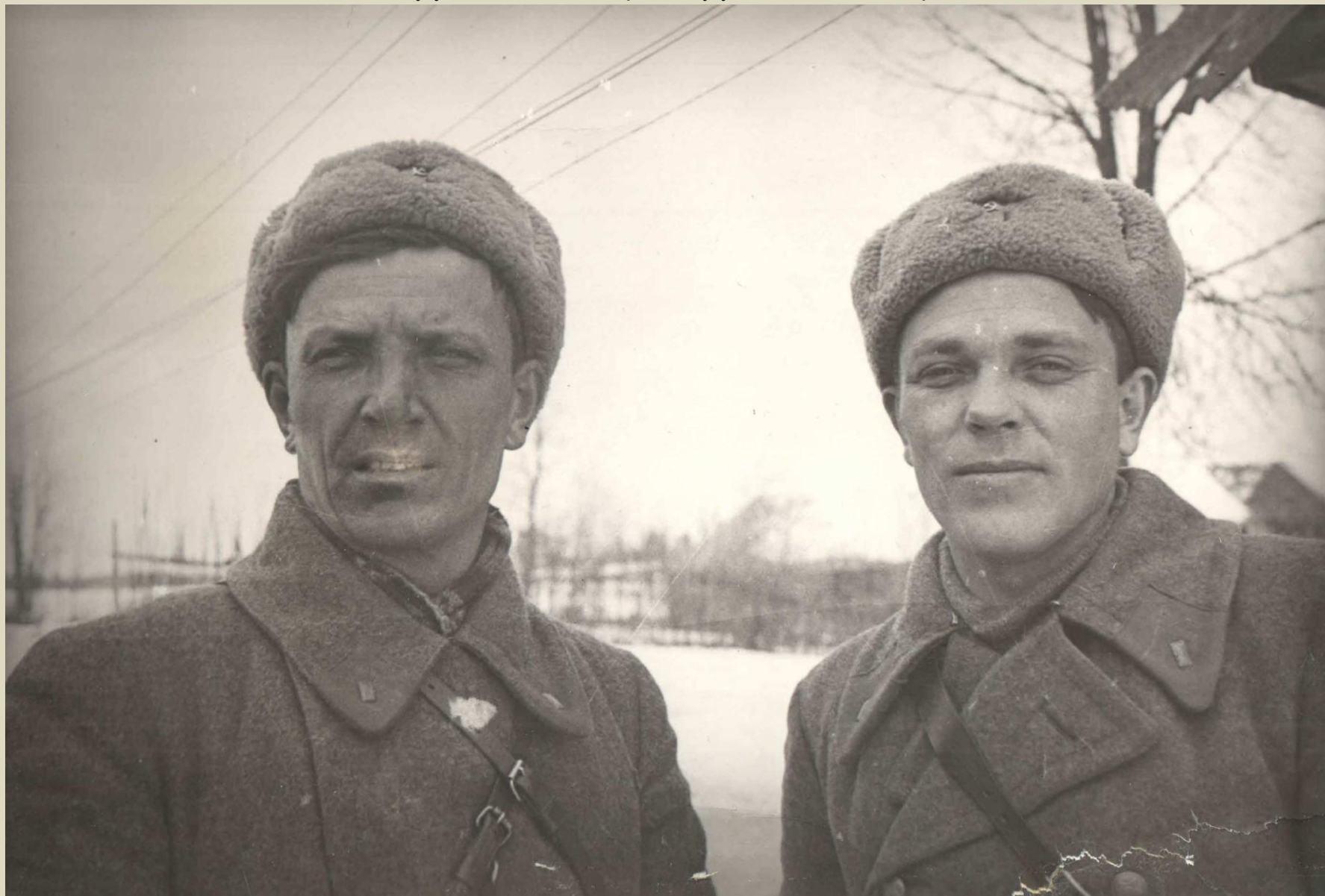
ВЕРСТАК и КАГАКОВ