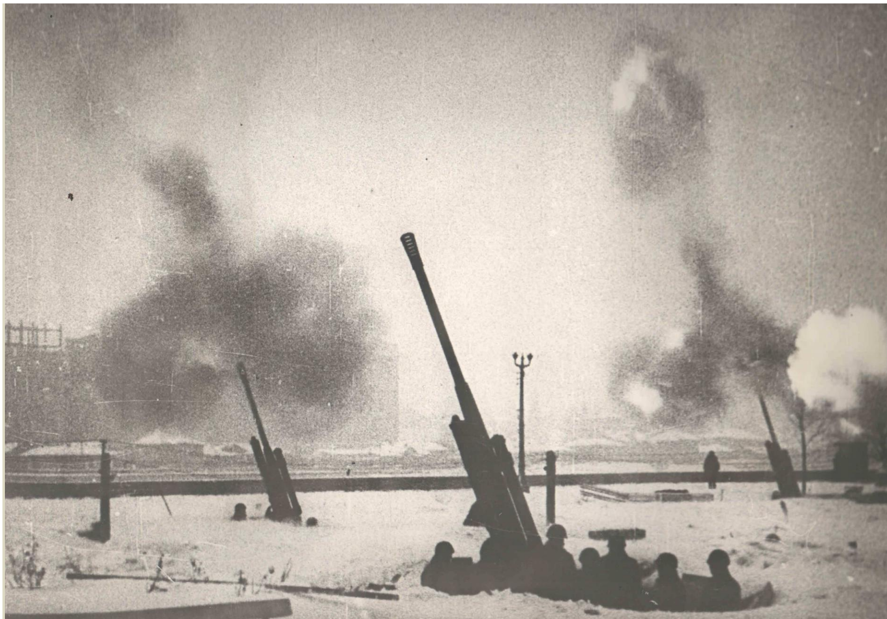
МОСКВА ЗИМОЙ 1941