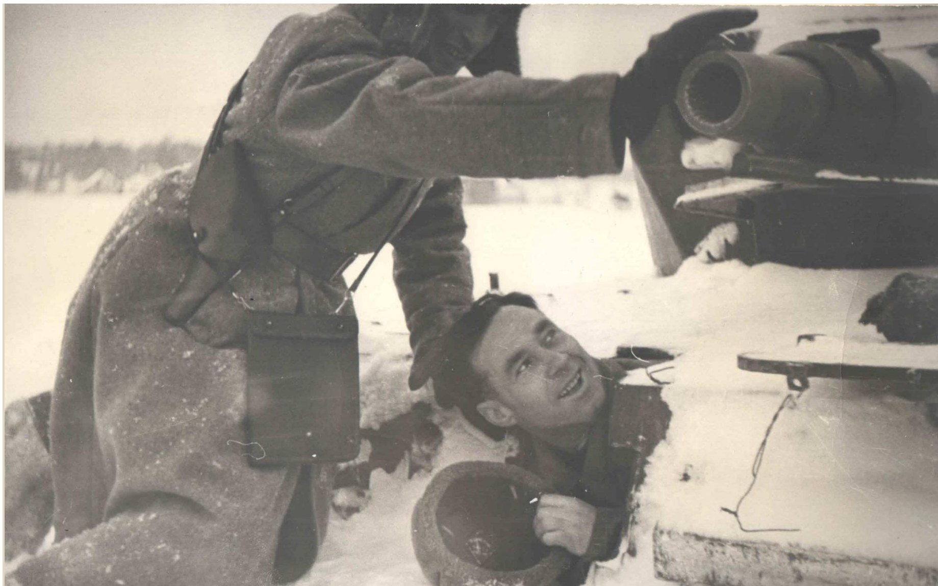
ОСМОТР ПОДБИТОГО НЕМЕЦКОГО ТАНКА