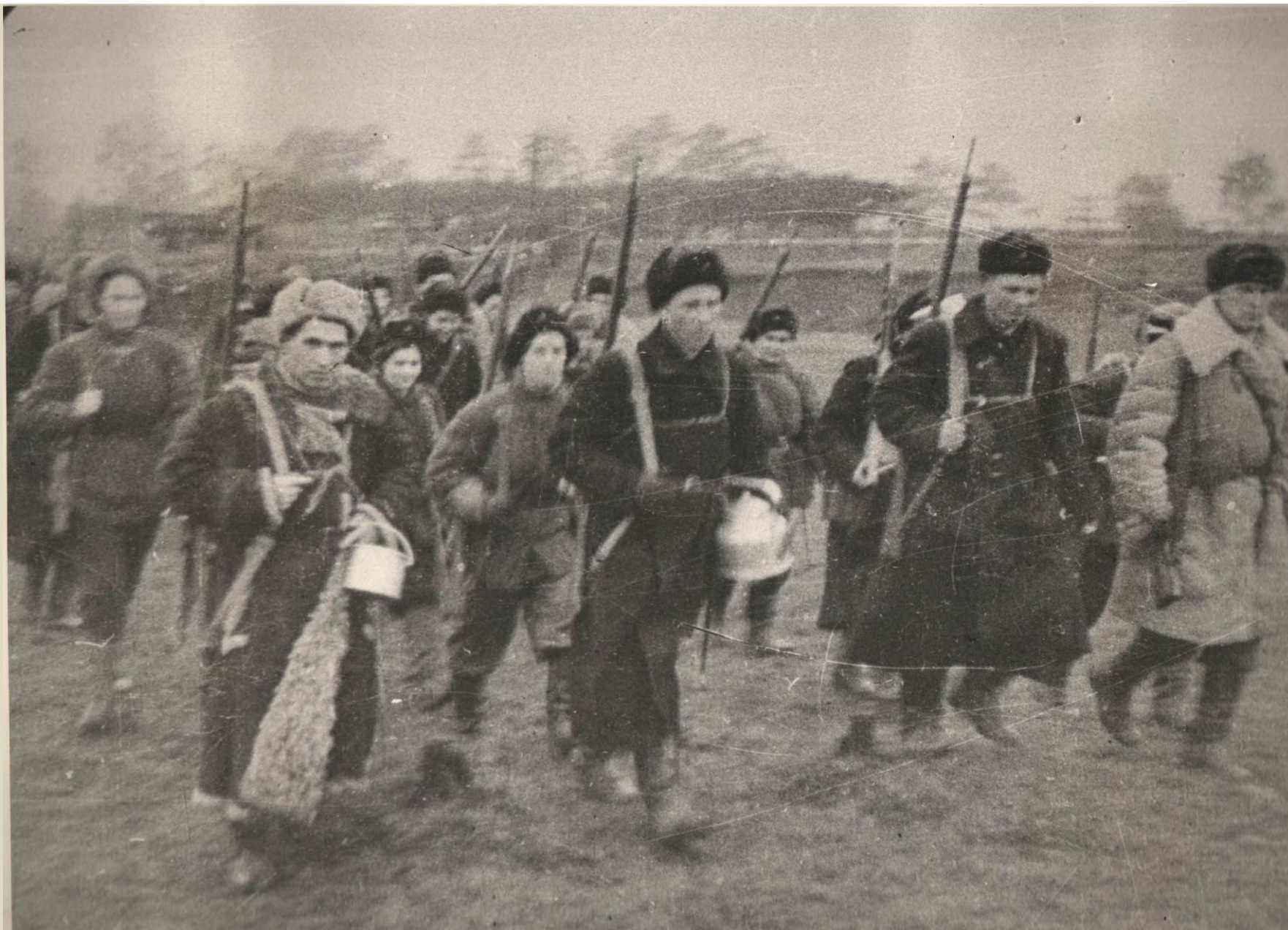
ДОБРОВОЛЬЦЫ ВЫХОДЯТ НА БОЕВЫЕ ПОЗИЦИИ