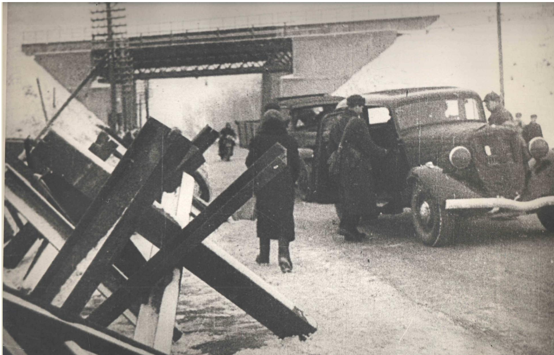
МОСКВА ЗИМОЙ 1941