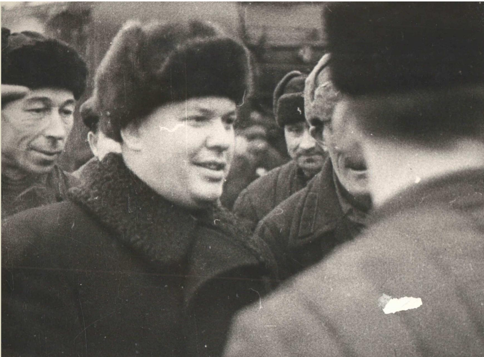
ПОПОВ - СЕКРЕТАРЬ МГК ВКП(Б)