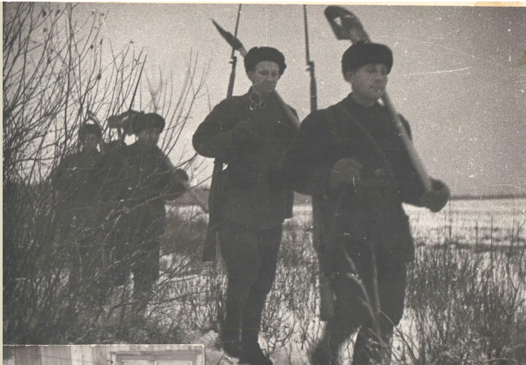
НА ОБОРУДОВАНИЕ БОЕВЫХ ПОЗИЦИЙ